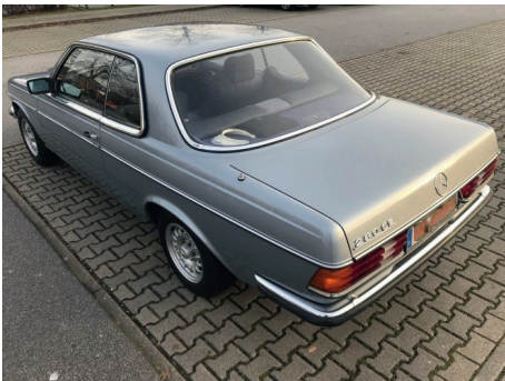
Heck hinten links