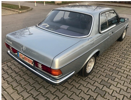
Heck hinten rechts