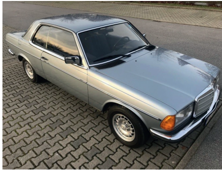
Front vorne rechts