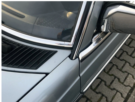
Scheibe vorne links (Lack, Scheibengummi, Spaltmaß, Außenspiegel)