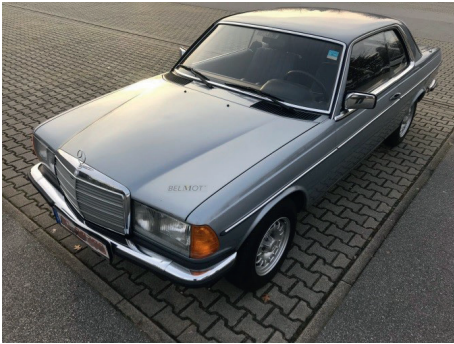
Front vorne links

Bitte fotografieren Sie Ihr Fahrzeug im Querformat wie folgt: